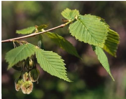
Zweige der Flatter Ulme

Die Flatter-Ulme ist ein heimischer Laubbaum mit sehr unterschiedlichen Standorten. Sie trotz mehrere Monate dem Hochwasser und kommt auch mit dem trockenwarmen Stadtklima gut zurecht. Ihre Existenz ist hierzulande dennoch bedroht.