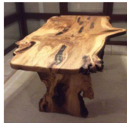
Tisch aus gemasertem Flatter-Ulmenholz, Foto: www.urholz.de

Schon seit prähistorischen Zeiten hat der Mensch Ulmen gezielt genutzt. Aus ihrer Rinde ließ sich guter Bast gewinnen, feiner und weicher als der von Linden, deren Nutzung als Bastlieferant am verbreitetsten war. Auch für die eiweißreichen Blätter der Ulmen fand man gute Verwendung. Sie dienten als ein besonders hochwertiges Viehfutter. Zu diesem Zweck schneitelte man die Bäume. Die belaubten Zweige wurden noch vor dem Herbst abgeschnitten, getrocknet und im Winter schließlich an die Tiere verfüttert. Aus dem zäh-elastischen Holz der Ulmen wurden in der